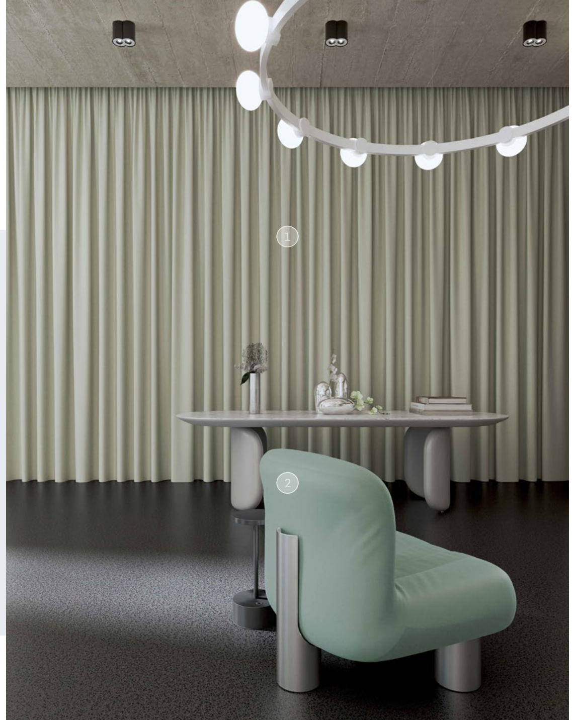
① Starlight 03-Oyster

FR-One-Gewebe sind Hochleistungsprodukte. Unsere Stoffe haben starke Schallabsorptionseigenschaften; getestet nach ISO 354-11654 sind viele unserer Designs „extrem absorbierend“ der Kategorien A und B eingestuft.